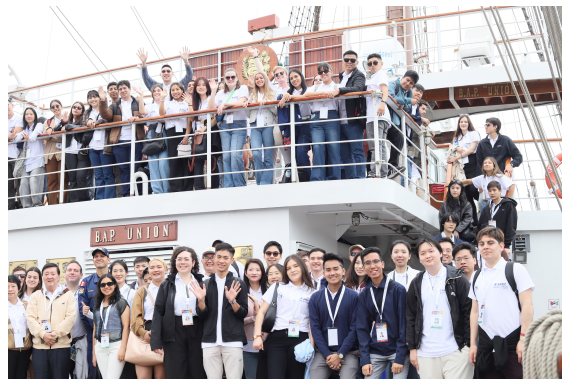
Fotografías de la delegación chilena en las distintas actividades de Voices of the Future (VoF).

Los jóvenes chilenos participaron en la redacción de la "Declaración de la Juventud" de APEC, la que estuvo inspirada en el lema "Empoderar. Incluir. Crecer" que Perú estableció para este año en el que estuvo al frente de APEC. Esta declaración fue entregada a autoridades del Consejo Asesor Empresarial de APEC (ABAC, por sus siglas en inglés). Los jóvenes participaron, también, de las distintas actividades de la Semana de Líderes de APEC, entre las que se incluyó la APEC CEO Summit. La delegación finalizó su participación con una presentación cultural que incluyó un relato y canto para resaltar las principales características de nuestra economía.