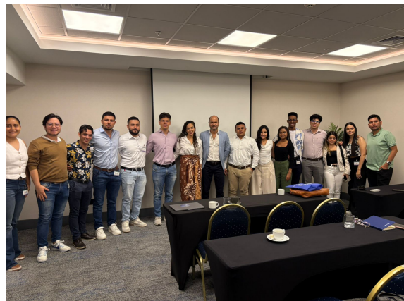
Fotografías del encuentro.

Agradecemos a la Universidad Icesi por la invitación a participar en un diálogo sobre algunas de las prioridades de política comercial de Chile en el Asia Pacífico/Indo Pacífico y el papel que la Fundación Chilena del Pacífico cumple para favorecer puentes público-privados que fortalezcan y expandan la proyección económica de nuestro país.