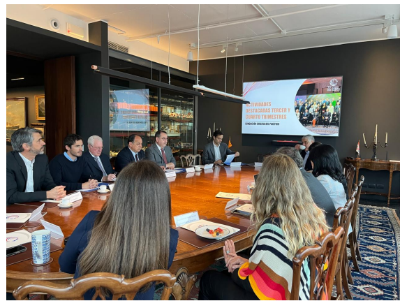
Fotografías de la reunión de directorio.