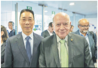
Niu Qingbao, embajador de la República Popular China y José Miguel Insulza, senador y presidente de la comisión de Relaciones Exteriores del Senado.