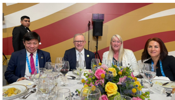
Fotografías del Diálogo entre ABAC y los Líderes de APEC.

Realizamos el seminario “Implementación del CPTPP: Progresos y Efectos en el Comercio y las Inversiones”