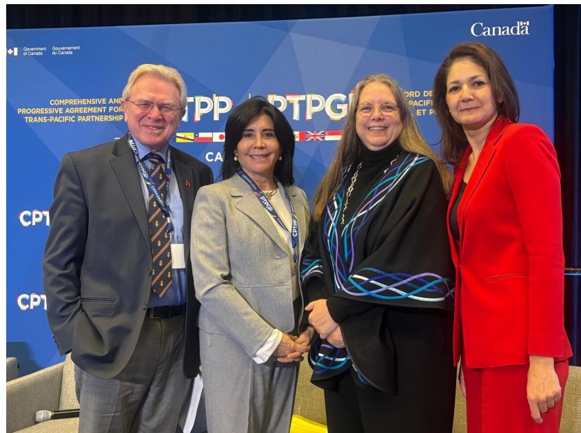
Fotografía del panel "Trade Diplomacy and the Role of Inclusive Trade".