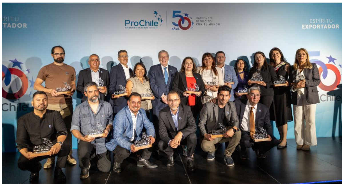
Fotografía del encuentro.

Felicitaciones a ProChile y a sus profesionales en el país y repartidos por el mundo por el medio siglo de vida de esta institución, que cumple un papel fundamental en un país con fuerte vocación exportadora como el nuestro. Cinco décadas de trabajo para abrir mercados a la fuerza productiva nacional en prácticamente todos los rincones del orbe.