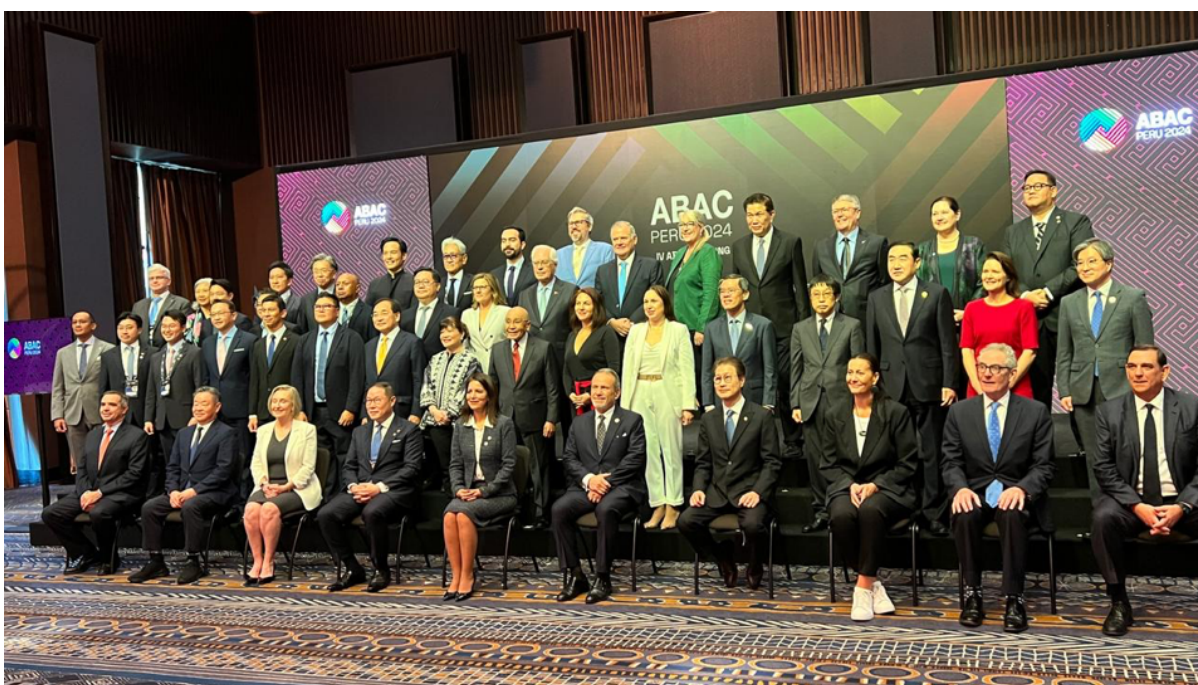
Fotografía del Consejo Asesor Empresarial de APEC en la cuarta reunión de ABAC en Lima, Perú.

ABAC, en sus recomendaciones de este año (todas las cuales están contenidas en el reporte anual que se le entrega a los Líderes de APEC) llama a priorizar las necesidades de las micro, pequeñas y medianas empresas, en particular aquellas dirigidas por mujeres y empresarios indígenas. También recomienda políticas para promover la digitalización y proporcionar un acceso equitativo al financiamiento, incluido el capital de riesgo, para las mujeres empresarias, y considera que las herramientas digitales son clave para integrar más empresas a la economía formal y conectar a las MIPYMES con las cadenas globales de valor.