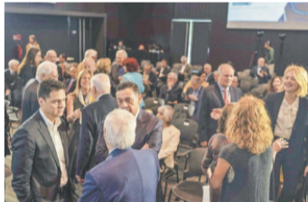
Asistentes al seminario de aniversario de la Fundación Chilena del Pacífico.