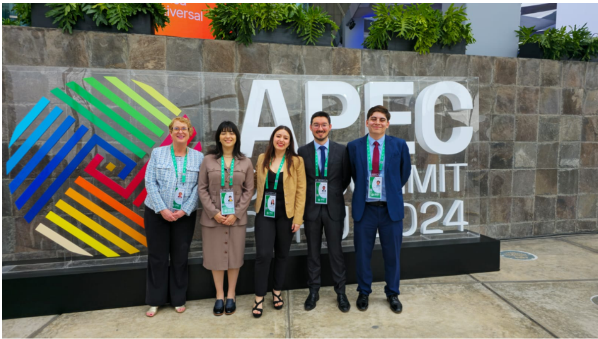
Fotografía de la delegación chilena de Voices of the Future (VOF).

Por primera vez de forma presencial, una delegación de jóvenes representó a Chile en el programa APEC Voices of the Future (VOF), edición que se llevó a cabo en Lima, Perú, y que se realizó al alero de la Semana de Líderes de APEC, instancia a la que asisten las máximas autoridades de las 21 economías que integran el foro de Cooperación Económica del Asia Pacífico (APEC).