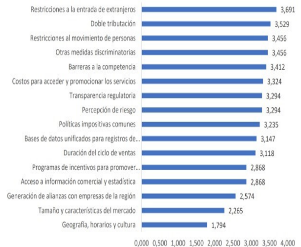
Promedio de respuestas sobre factores que afectan a las exportaciones de servicios digitales dirigidas hacia América Latina y el Caribe, 2023

Tributación uno de los principales obstáculos para la internacionalización del sector